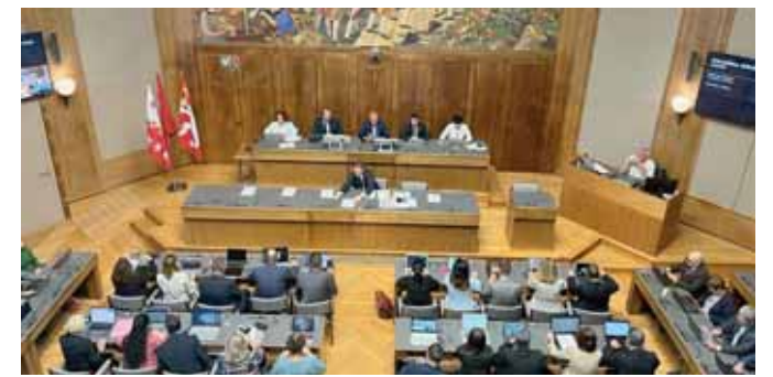
Le Grand Conseil se prononcera lors de la session 2022.

La situation ne peut s'améliorer qu'en cas de pluie persistante d'au moins trois jours et de plus de 30 mm/m, précise le canton.