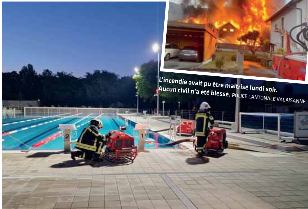
Les sapeurs ont pompé 5000 litres à la minute. Malgré cette opération, la piscine a pu être ouverte ce mardi au public.

Un pompier a toutefois subi «un coup de chaud» alors qu'un second s'est blessé à l'épaule. Aujourd'hui, «Ils se portent